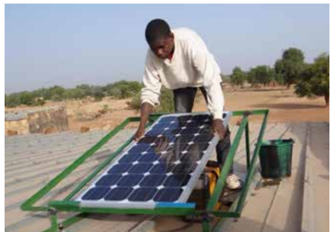
Licht aus Solarstrom.

Licht vereinfacht das alltägliche Leben der ländlichen Bevölkerung in Burkina Faso. Sowohl für Bildung wie auch für das Gesundheitssystem ist Solarstrom oftmals die einzige Möglichkeit, außerhalb der Sonnenstunden arbeiten zu können. Der Verein Sonnenenergie für Westafrika (SEWA) und die IEW arbeiten seit vielen Jahren bei diesen Projekten erfolgreich zusammen. Im Jahr 2021 wurden die Schulen in den Orten Goû, Tomabissi und Béchabia mit Solaranlagen ausgestattet. Rund 13.000 Euro wurden für diese drei Schulen dafür aufgewendet, wobei sich das Land Oberösterreich mit 40 % an der Finanzierung beteiligte. Der Rest sind Spendengelder an die IEW. In den vergangenen elf Jahren wurden von der IEW 25 Schulen und neun Krankenstationen mit Solarstrom versorgt.