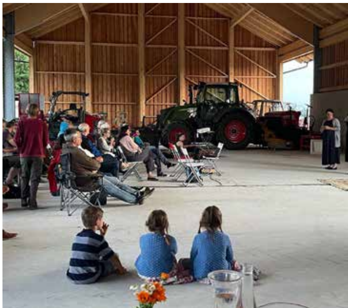
Open-Air-Kinoerlebnis am Biohof Bretterbauer. Eine gemeinsame Veranstaltung von IEW und dem Verein kuli.

Es ist eines der ehrgeizigsten Klima-Projekte der Welt, das dieser beeindruckende Film zeigt. In der Sahelzone, quer über den afrikanischen Kontinent, wird ein 8.000 Kilometer langer Gürtel aus Bäumen gepflanzt.