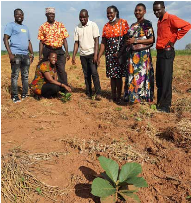
Die Verantwortlichen für das Aufforstungsprojekt sind stolz auf die positive Entwicklung.

IBAN: AT94 2040 4066 0500 0062, BIC SBGSAT2S, können Sie für das Projekt spenden.